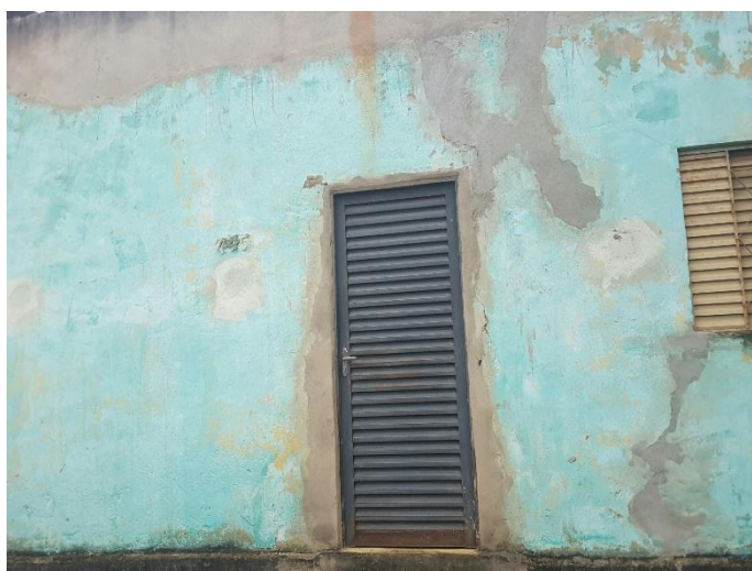
Figura 1. Registro fotográfico da visita.

No dia 09/06/2017, equipe técnica da empresa Synergia, enviou SMS para os números declarados pelo manifestante, com o objetivo que a família entre em contato com a empresa para realização do Cadastro Integrado.